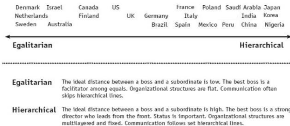
FIGURE 4.1. LEADING

C) Take the definitions of countries with egalitarian and hierarchical leading styles presented below and apply them to specific examples of behavior (use letter “E” for the Egalitarian and “H” for the Hierarchical leading style).