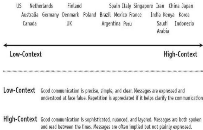
FIGURE 1.1. COMMUNICATING