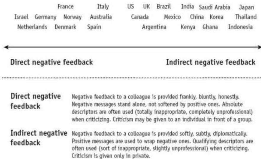
FIGURE 2.2. EVALUATING